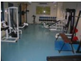
Education physique et sportive