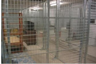
Entraînement au port de l'appareil respiratoire isolant