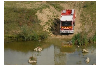
Plateau conduite hors chemin