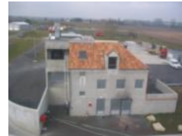
Maison à feu