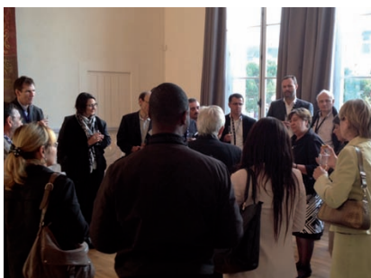
Les rencontres sont toujours l'occasion d'échanger.