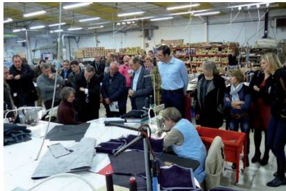
Les visites d'entreprise sont l'occasion de découvrir les savoir-faire locaux.

Le premier projet fédérateur a été la construction d'une cabine de toilette sèche réalisée à 100 % par des entreprises du Sud-Vienne. « Douze entreprises du club ont travaillé à la conception et réalisation de cette cabine unique, écologique et accessible aux personnes à mobilité réduite. En 2012, Sany Coinvert, notre